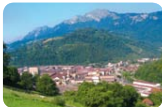
Savoie / Ugitech