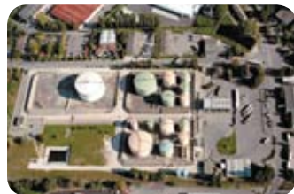
Haute-Savoie / groupement pétrolier