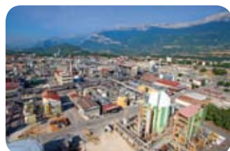
Isère / plateforme Pont de Claix