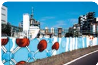
Rhône - Pierre-Bénite / Arkema