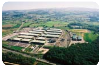
Loire - Andrézieux / SNT