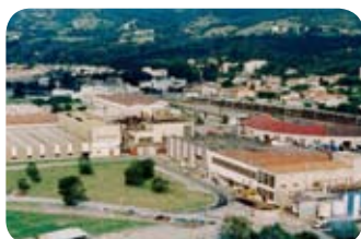
Ardèche - La Voulte / PCF