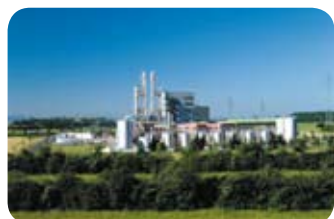
Ain - PIPA / Speichim

Quelques exemples de sites industriels en Rhône-Alpes