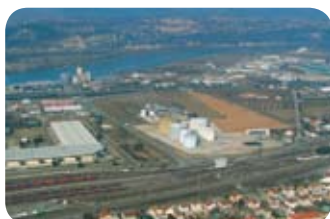
Drôme - Valence / Dépôt pétrolier